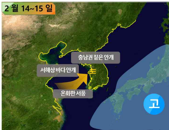
[ 14~15일 기압계 모식도 ]