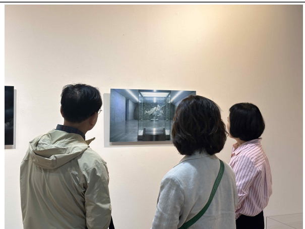
기상·기후 사진전 관람 사진