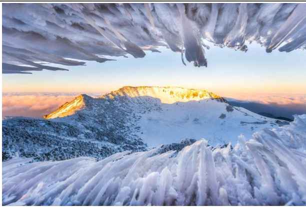
얼음 속 한라산_김정국(2024년 대상)