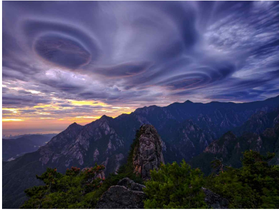
구름이 빛은 소용돌이_석기철(대상)