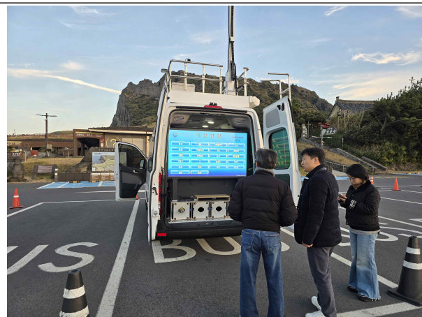
기상관측차량 관람 사진