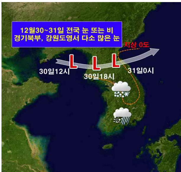
< 30일~31일 예상 기압계 모식도 >