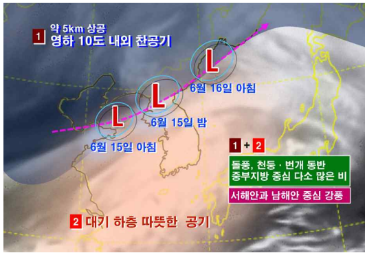
< 2016년 6월 15일(수) 낮 기압계 모식도 >