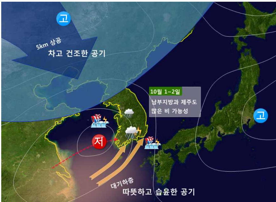
< 10월 1일(일)~ 2일(월) 예상 기압계 모식도 >