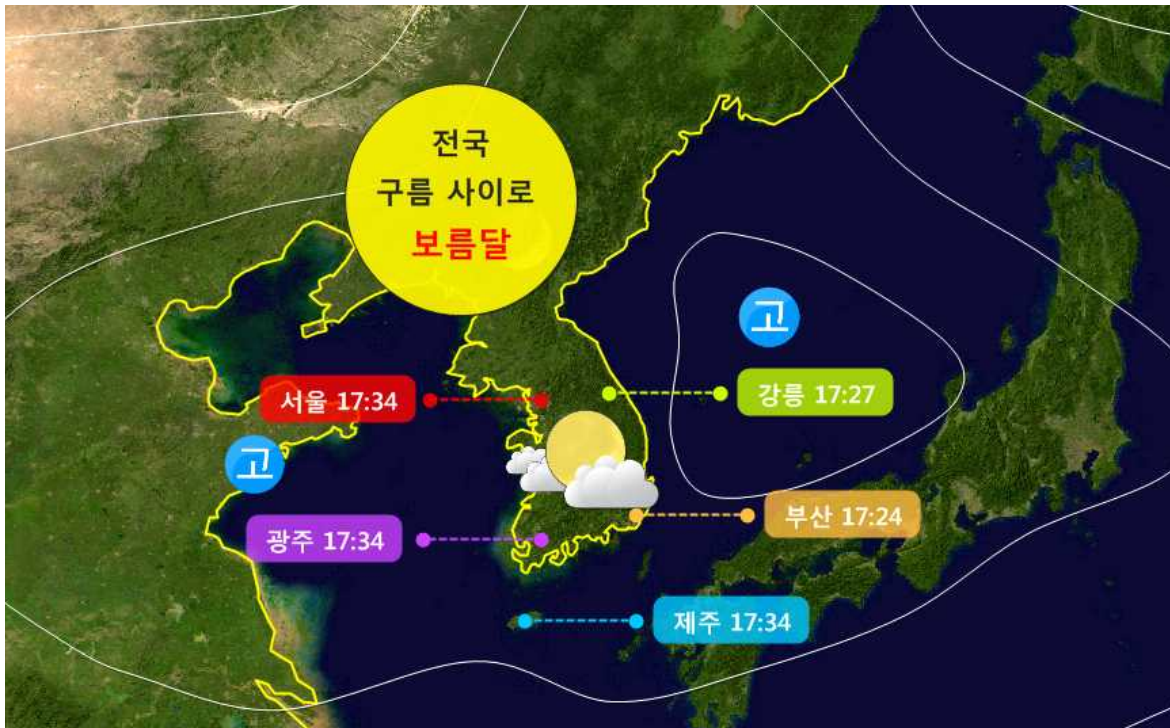
< 10월 4일(수) 추석날 예상 기압계 모식도 및 월출 시각 >