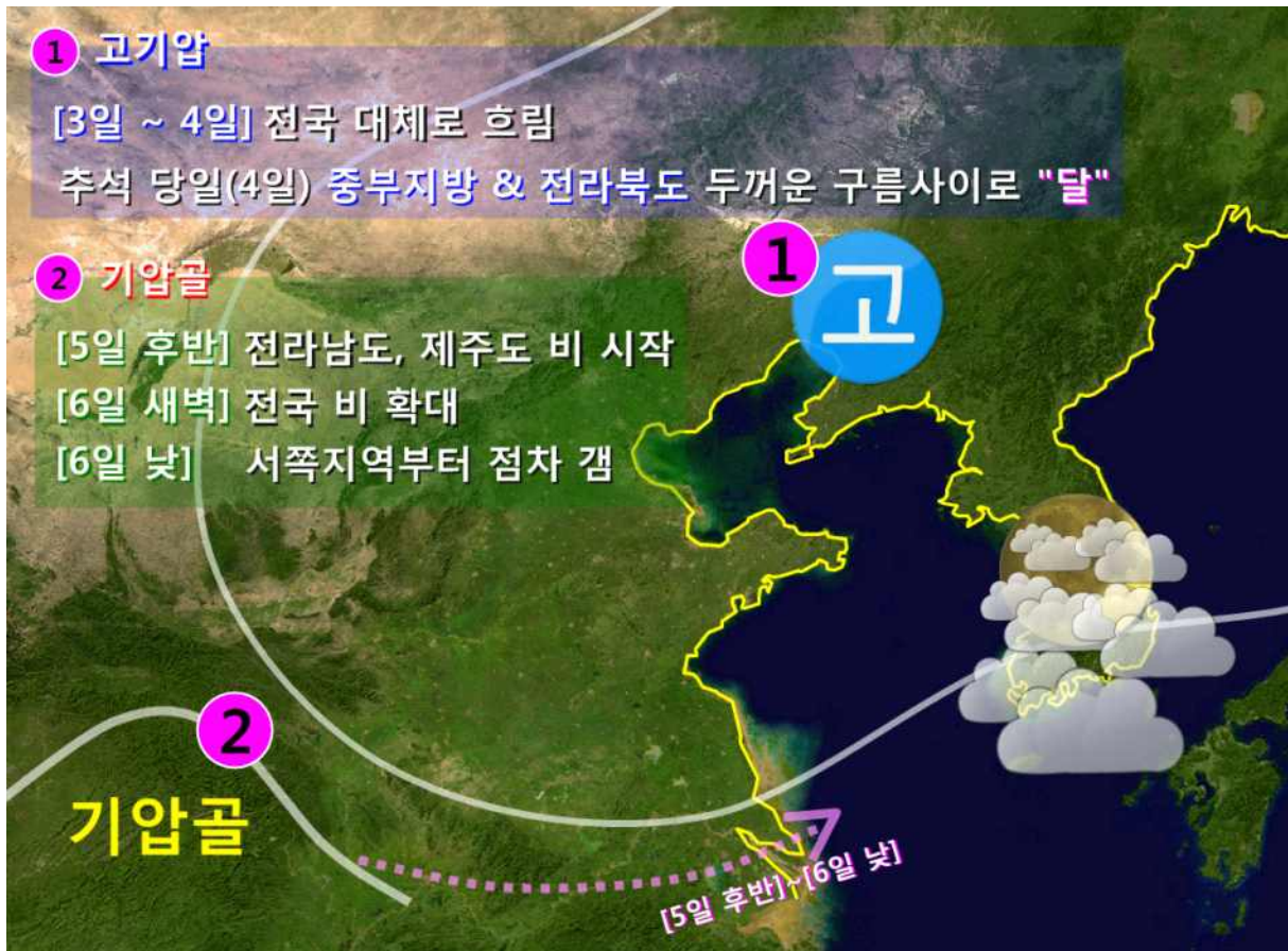
[ 10월 3일(화)~ 6일(금) 예상 기압계 모식도 ]