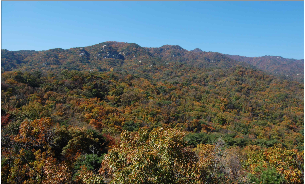
구름전망대에서 북한산을 바라본 전경1