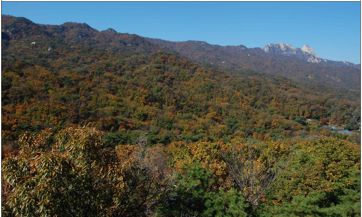
구름전망대에서 북한산을 바라본 전경2