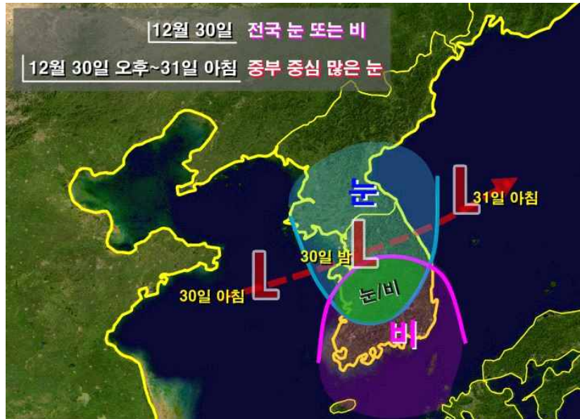
< 30일(토) 밤 예상 기압계 모식도 >