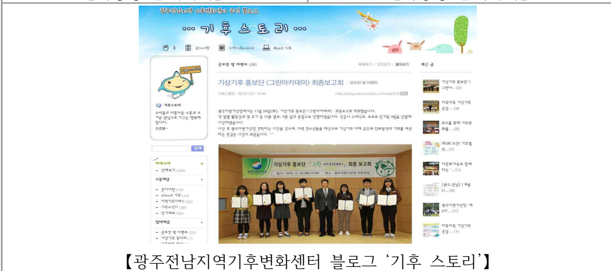
【광주전남지역기후변화센터 블로그 '기후 스토리'】