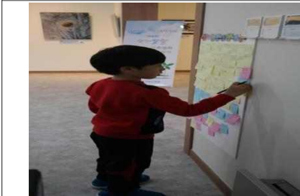
사진전 참여 후기 게시판 1