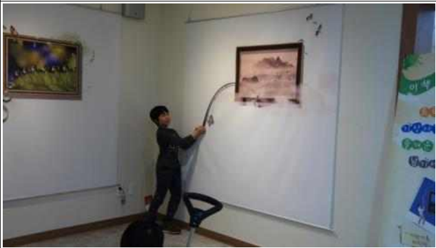
트릭아이 사진 체험 2