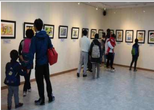
생기발랄 작품 관람