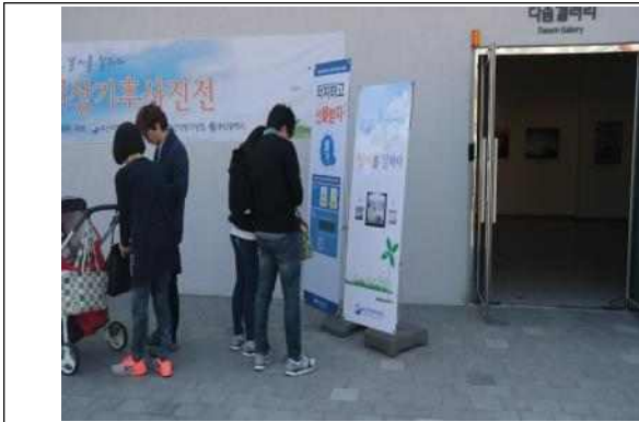
이벤트 참여 1