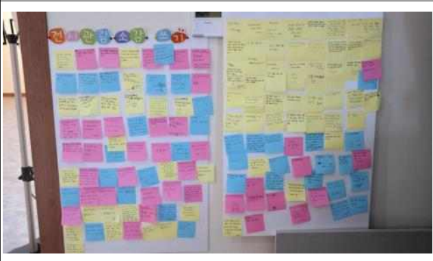
사진전 참여 후기 게시판 2