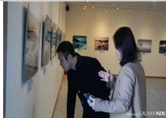
사진전 NFC 체험