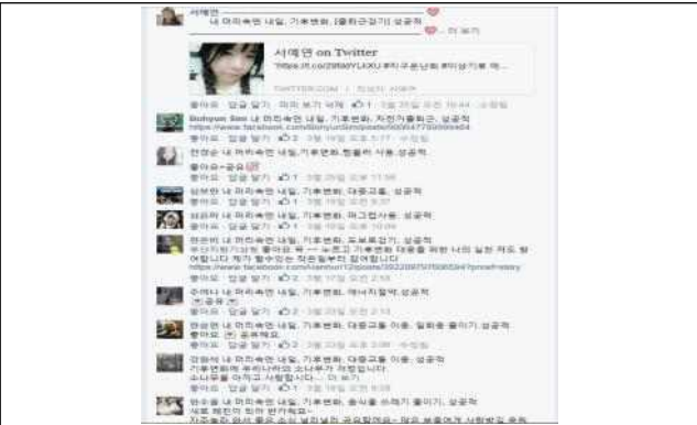
이벤트 참여 2