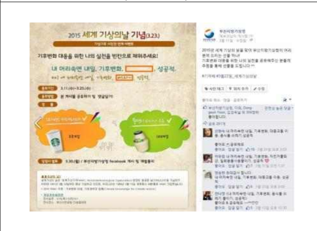
이벤트 참여 4