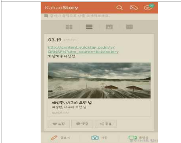
이벤트 참여 3