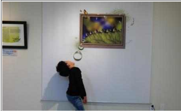
트릭아이 사진 체험 1