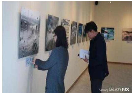
사진전 NFC 체험