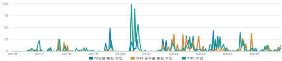
시간대별 유입 통계